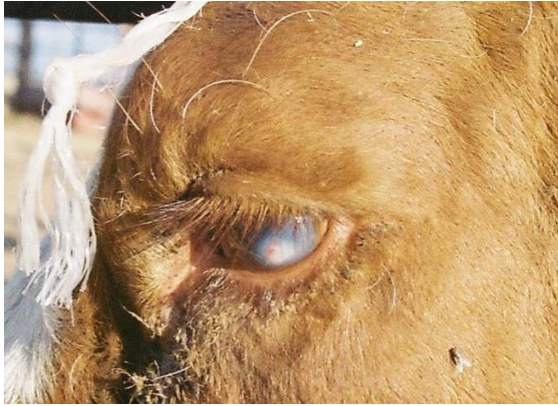
Resim 1. Korneada keratitis (FAO 2015).

Doğada uzun süre canlılığını sürdürebilen etken, nekrotik deride 35 gün canlı kalır (Anonim, 2005; Anonim 2008). Güneş ışınlarına karşı duyarlı olan etken, karanlık bölgelerde aylarca canlı kalabilir. Eksi 80 °C'de muhafaza edilen deri nodüllerinde 10 yıl kadar canlılığını sürdürebilen virüs, 55 °C'de 2 saatte, 65 °C'de 30 dakikada yıkımlanır (EFSA, 2015). Kloroform, % 20 eter, %1 formalin, % 2'lik fenol, % 2-3 sodyum hipoklorit, 1/33 oranında sulandırılmış iodeine solüsyonu ve %2'lik Virkon'a karşı duyarlıdır (Anonim, 2008; EFSA 2015).